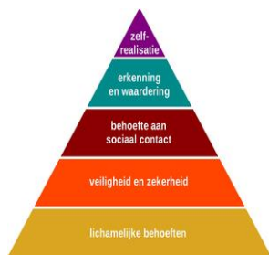
Figuur 3. Behoeftepiramide van Maslow (Piramide van Maslow, n.d.)

Maslow was ervan overtuigd dat een kind altijd eerst alle stappen van de behoeftepiramide moest doorlopen. Als er een stap tussenuit zou vallen, zou er altijd weer opnieuw gewerkt moeten worden aan die stap tot dat er is voldaan aan die behoefte. Stap voor stap bereikt een kind zelfverwerkelijking. (Abraham Maslow, n.d.)