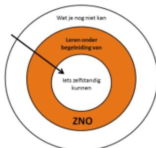
Figuur 4. Zone van naaste ontwikkeling

Hierbij kan de pedagogisch medewerker het kind stimuleren. De pedagogisch medewerker bepaalt door observaties waar de behoefte van het kind ligt en biedt gericht activiteiten aan. Zie figuur 4 De zone van naaste ontwikkeling.