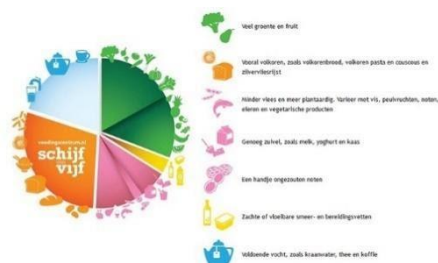
Figuur: Schijf van Vijf Voedingscentrum