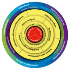
Figuur 1. Cirkel van basisontwikkeling (Startblokken van Basisontwikkeling, n.d.)

Om de kwaliteit van ontwikkelingsgericht handelen optimaal te houden en te verbeteren maken de medewerkers gebruik van de kwaliteitscirkel van Deming. De processen kunnen hiermee nauwlettend gevolgd en aangepast worden waardoor de kwaliteit verbetert. De processen komen ook tijdens teamvergaderingen aan bod. Zie figuur 2.