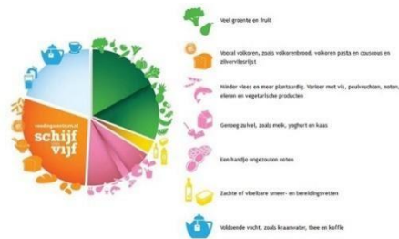
Figuur: Schijf van Vijf Voedingscentrum