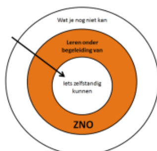
Figuur 4. Zone van naaste ontwikkeling

Hierbij kan de pedagogisch medewerker het kind stimuleren. De pedagogisch medewerker bepaalt door observaties waar de behoefte van het kind ligt en biedt gericht activiteiten aan. Zie figuur 4 De zone van naaste ontwikkeling.