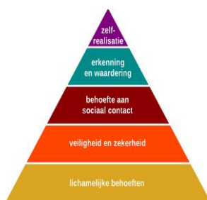
Figuur 3. Behoeftepiramide van Maslow (Piramide van Maslow, n.d.)

Maslow was ervan overtuigd dat een kind altijd eerst alle stappen van de behoeftepiramide moest doorlopen. Als er een stap tussenuit zou vallen, zou er altijd weer opnieuw gewerkt moeten worden aan die stap tot dat er is voldaan aan die behoefte. Stap voor stap bereikt een kind zelfverwerkelijking. (Abraham Maslow, n.d.)