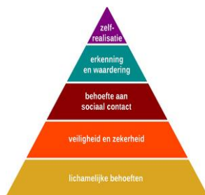
Figuur 3. Behoeftepiramide van Maslow (Piramide van Maslow, n.d.)

Maslow was ervan overtuigd dat een kind altijd eerst alle stappen van de behoeftepiramide moest doorlopen. Als er een stap tussenuit zou vallen, zou er altijd weer opnieuw gewerkt moeten worden aan die stap tot dat er is voldaan aan die behoefte. Stap voor stap bereikt een kind zelfverwerkelijking. (Abraham Maslow, n.d.)